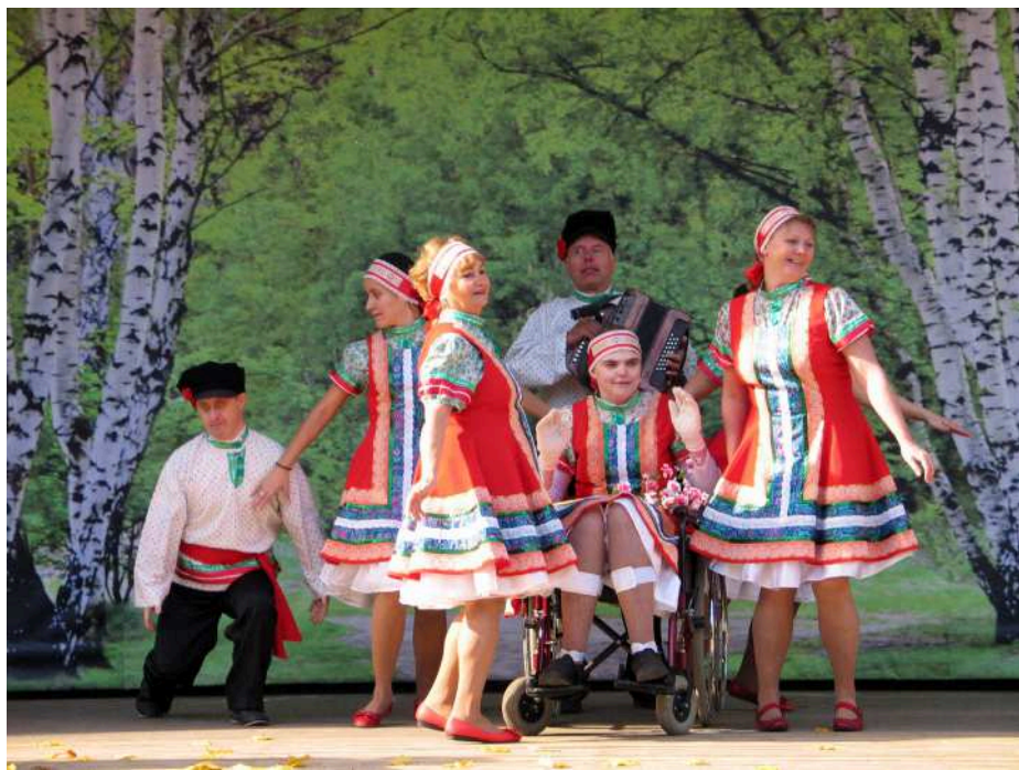
Праздничный концерт от инвалидов и для инвалидов

Собравшихся приветствовали начальник Управления по обеспечению социальных