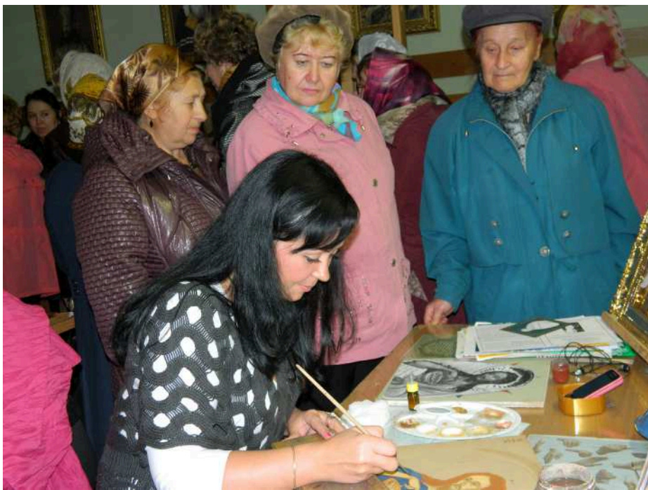
Иконописец за работой