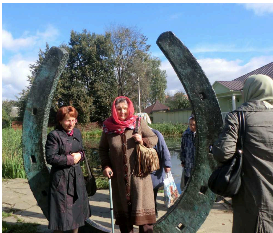
Проход сквозь счастливую подкову

В самом центре города возвышается Дмитровский кремль, очень красивый, белоснежный. Дмитровский Кремль является одним из самых интересных мест в Подмосковье. Сохранился довольно значительный земляной вал, первоначально имевший периметр около километра. Реконструирован участок деревянного Кремля с входными бревенчатыми воротами.