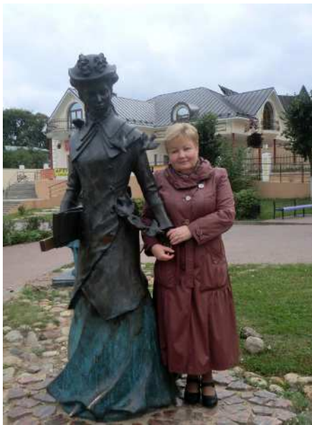
Тургеневские барышни из Дмитрова и Павловского Посада

Жемчужиной Дмитровского Кремля является Успенский Собор, построенный в 1512 г. и украшенный мозаичными плитками 16 века. Его прототипом считают Архангельский Собор Московского Кремля. Великолепный пятиярусный иконостас с иконами XVI века встречает посетителей своей торжественностью. Трехъярусная колокольня Успенского собора была построена уже позже, в 1796 г.