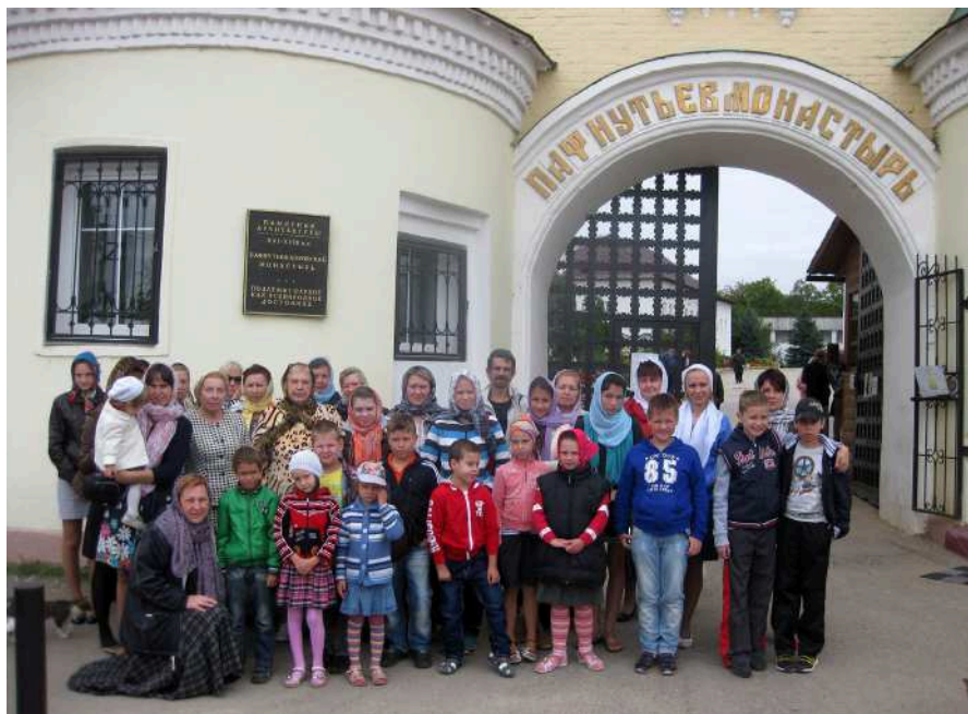
Ленинские инвалиды идут в гости к святому Пафнутию

Паломники - дети и взрослые - окунались в святые источники, расположенные возле храма. Источников здесь три: в честь святого Николая Чудотворца, во имя иконы Казанской Божией Матери и в честь