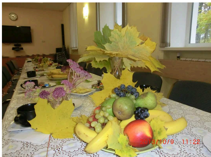
Осенний натюрморт ждёт гостей праздника