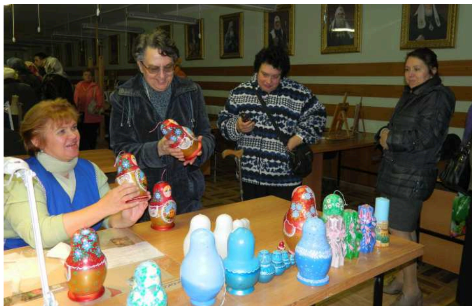
«Ручная роспись матрёшек»