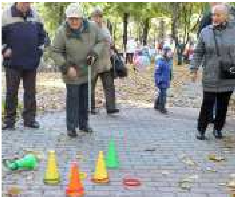
Популярная забава – кольцеброс