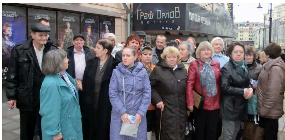
Ждём аудиенцию с графом