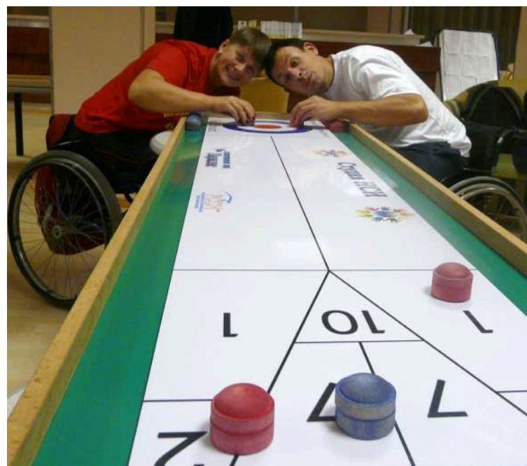
Мастер-класс и турнир по настольным играм притягивают

Традиционное торжественное открытие фестиваля состоялось на площадке спорткомплекса «Юность» Адлерского курортного городка. На открытие спортсмены регионов вышли, одетые в нарядную спортивную форму, над каждой командой развивался флаг своего региона.