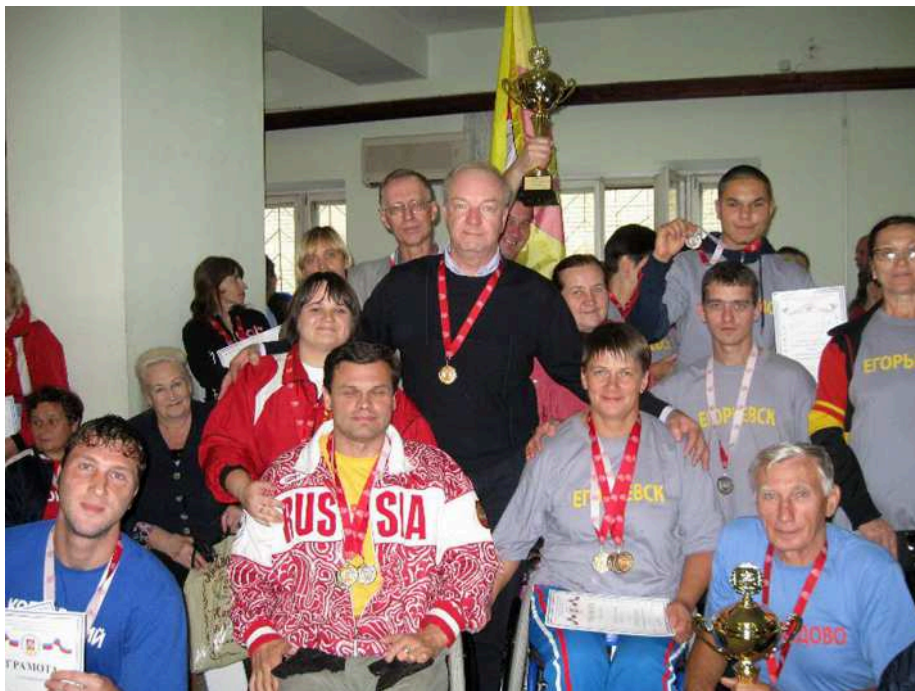
Кубки, медали, грамоты, подарки... Но самое главное – дружба!

На этом фестиваль спорта в Колонтаево завершился. Впереди некоторых спортсменов ждал Всероссийский фестиваль в Адлере, а кое-кого и поездка на Паралимпийские игры. Пусть пока в качестве зрителя в составе группы поддержки, но всё ещё впереди!