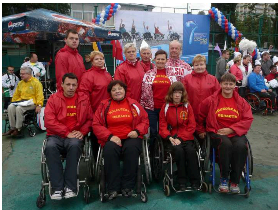
Команда МООИ ВОИ готова биться за медали

Посланцы регионов прибывали в Адлер по железной дороге, прилетали в новый, построенный к Олимпиаде аэропорт, некоторые добирались автобусами. По задумке организаторов, все прибывшие, автоматически становились строгими экспертами