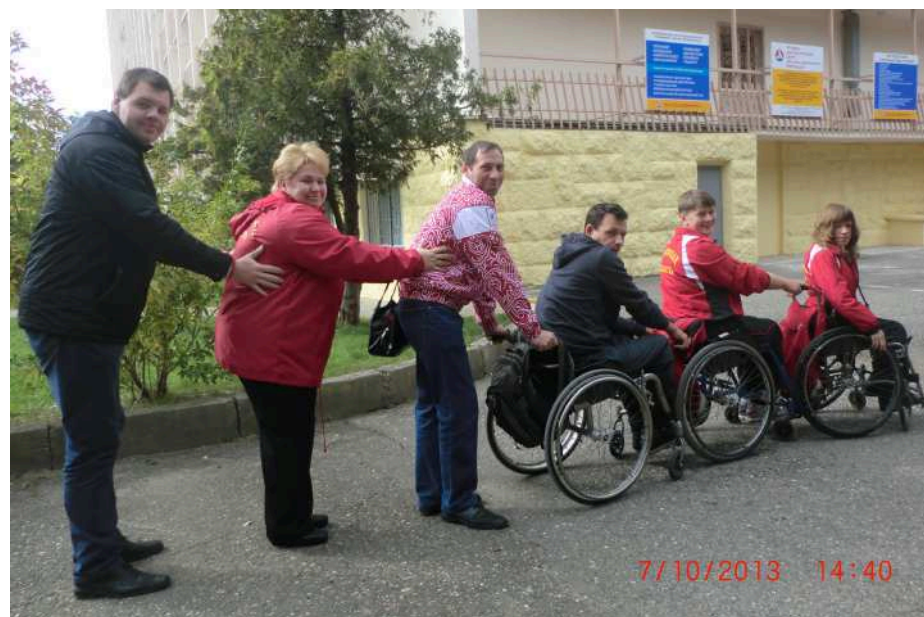
Было здорово, но пора домой

Погода, конечно, подкачала. Все дни соревнований лил дождь, а море штормило так, что волны обмывали окна проходящих поездов. Но нам не привыкать, и команда использовала для прогулок каждую свободную минуту, а самые смелые даже окунулись в воды Чёрного моря. На улице было всего 10 градусов тепла, а малочисленные