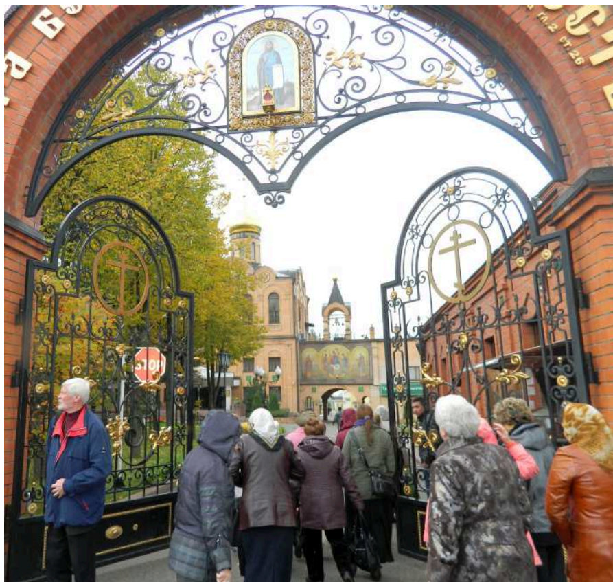
Врата в сказочный мир иконотворчества