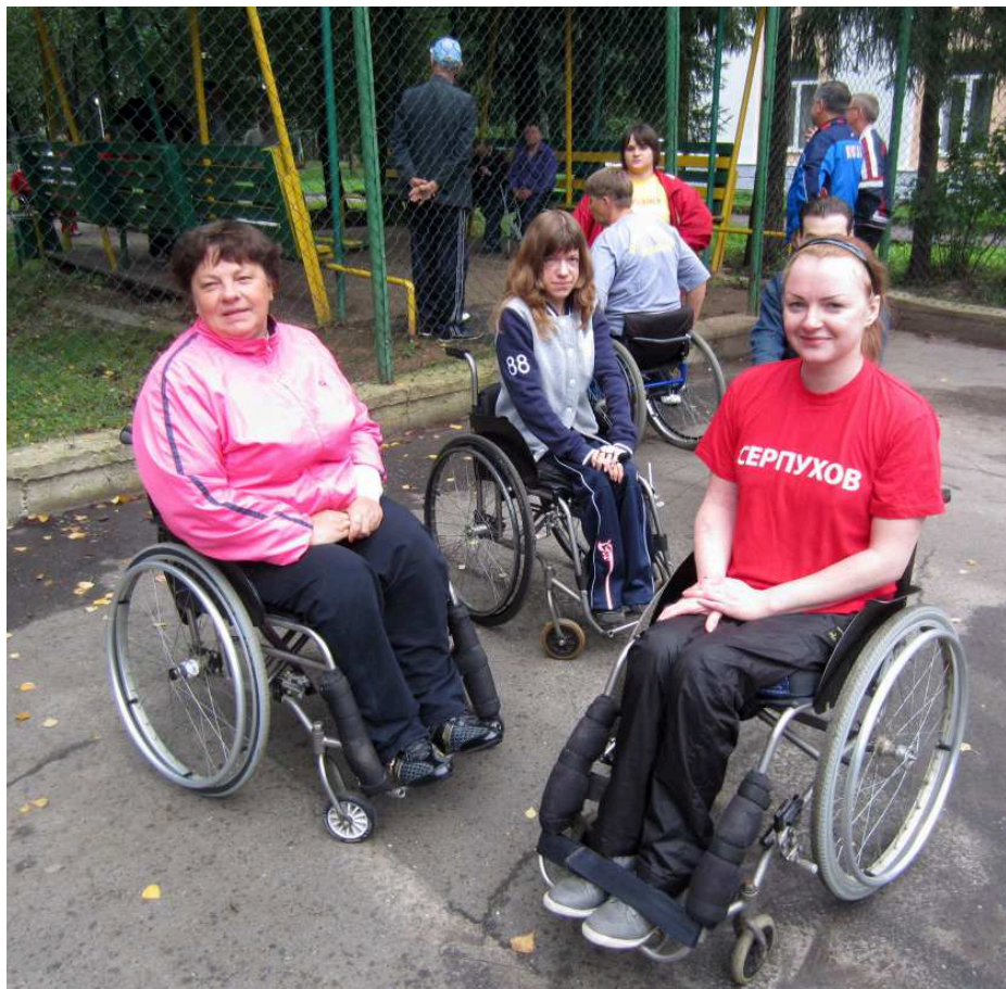
Через несколько минут начнётся бег на колясках

В Пауэрлифтинге отдельно соревновались силачи из ВОИ (ПОДА + колясочники) и общества слепых. В этот раз было решено не проводить