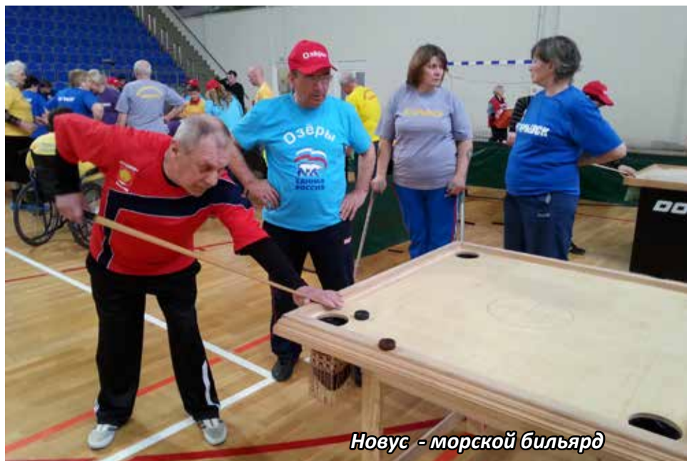
Новус - морской бильярд

Спасибо Администрации, ЛАТП за предоставление транспорта!