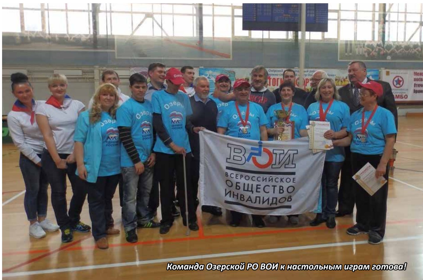
Команда Озёрской РО ВОИ к настольным играм готова!